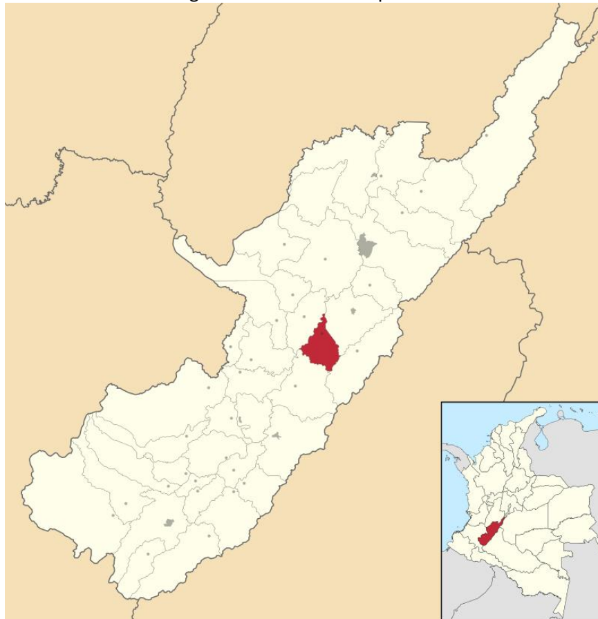
Imagen 1 ubicación municipio Hobo

Construcción de una Bocatoma fondo (Estructura de captación y derivación de Caudal de la quebrada Guasimilla), una bodega y anexos para certificación granja biosegura para abastecer los criaderos Piscícolas de la Unidad Productiva Dina Luz; la Bocatoma de Fondo es una estructura ubicada en el lecho de la fuente perpendicular al sentido de la corriente.