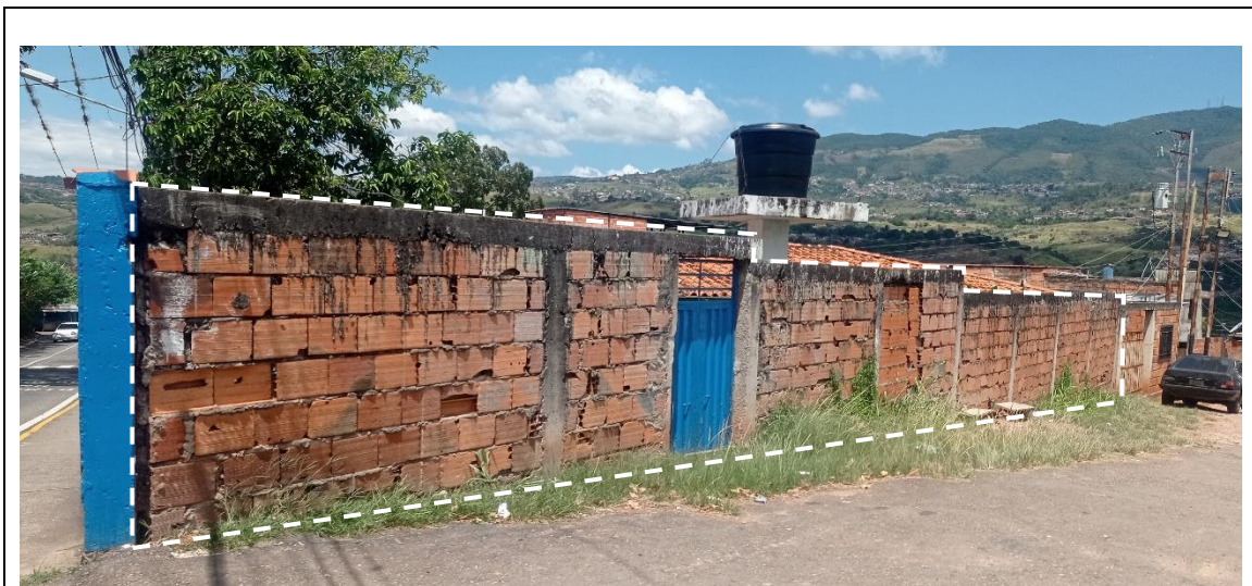
Vista general y actual del área para el mural. Al momento de realizar el mural la pared se encontrará frisada y pintada.